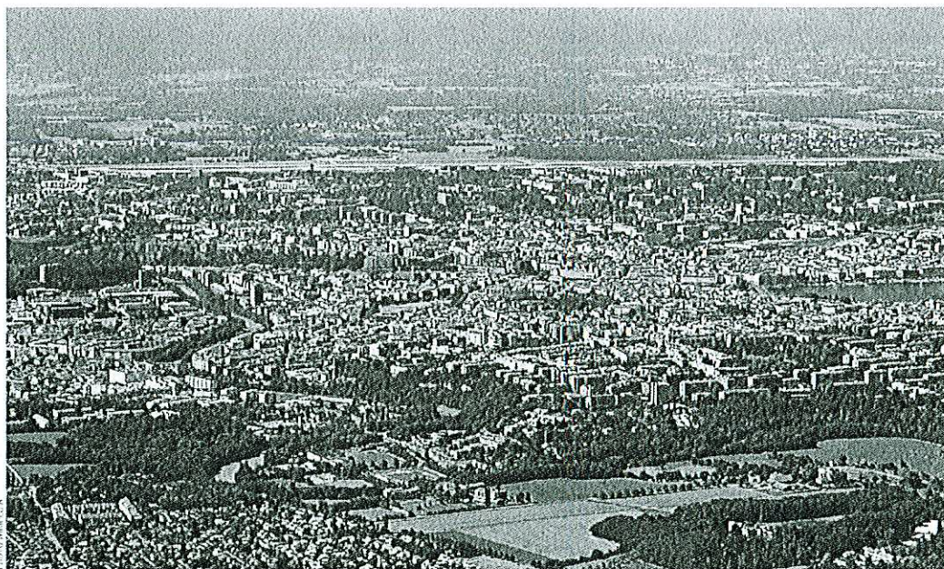
«CALVINGRAD»... Malgré son surnom évoquant certaine rigueur protestante, un lieu où se rencontrent des personnalités venant de parfois très loin et lui donnant une dimension presque surnaturelle

sement ce symbole de transmission. Quand j'entrai ce jour-là dans la synagogue, occupée jusqu'à la dernière place, l'office venait de commencer. Je vis une mer ondoyante de cafans multicolores, oscillant entre les divers bleus de l'eau ou du ciel et les mille et une nuances des sables du désert. Il s'en échappait une mélopée orientale qui s'élevait parfois en solos, ondulait d'un coin à l'autre de la salle, ne semblait obéir à aucune règle, était régulièrement reprise selon un code secret par le chœur pour repartir de plus belle. Chaque fidèle semblait avoir sa propre psalmodie, dans un ensemble flottant et sonore, dont le mouvement et l'intonation suivaient un rythme naturel auquel chacun était invité à se joindre, mais qui menaçait constamment de sombrer dans le chaos total. Le spectacle qui s'offrait à mes yeux était totalement différent du service pratiqué dans ma synagogue de la Freigutstrasse à Zurich où personne n'aurait osé enfreindre les règles strictes, de peur de s'attirer des regards réprobateurs. Ici, chacun pouvait aller et venir à sa guise sans que quiconque ne s'en formalise. J'avais l'impression que le désordre était admis, voire voulu, et qu'il était l'essence même de la vie de la communauté. Un nombre incalculable de familles, souvent accompagnées d'enfants en bas âge, assistaient à l'office. Tout le monde était paré de ses plus beaux atours et, pour