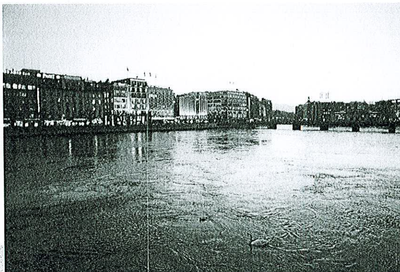
GENÈVE. Une cité dont les ondes ont parfois des courbes et des accents orientaux au charme indéfinissable mais infini...

rents libanais. C'était à Simkhat-Tora, dernier jour de la fête des Cabanes, clôture des grandes fêtes du début de l'année juive, et recommencement du cycle annuel de la lecture de la Torah. Pendant cette cérémonie, un fidèle, appelé khatan, le fiancé, lit le dernier passage de la Torah, et un autre, le khatan bereshit, récite les premiers versets de la Genèse. L'étude constante du Livre Sacré permet depuis des millénaires de transmettre de génération en génération la lumière de la foi. Aujourd'hui encore, Simkhat-Torah donne lieu à des manifestations de joie débridée, au cours desquelles toute la communauté, hommes, femmes et enfants, chante et danse en portant les rouleaux de la Torah dans la synagogue, afin de fêter joyeu- ➤