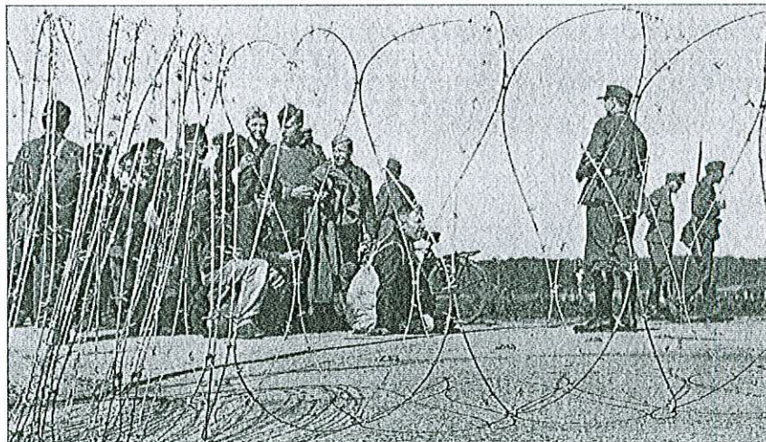
Réfugiés à la frontière suisse de Barga (SH) en avril 1945:

fondant davantage sur les témoignages que sur les rapports officiels, elles montrent que les Suisses ont souvent fait preuve d'une grande solida-