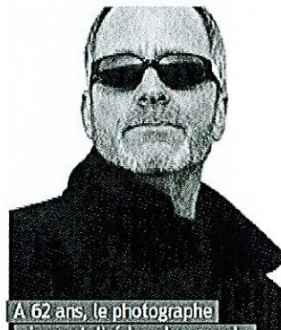
A 62 ans, le photographe a immortalisé les plus grands, de David Bowie à Batte Midler, en passant par Michael Jackson.

Lors du premier, le modèle trouvait qu'il était trop statique. Lors du deuxième, la lumière était mauvaise. Le troisième jour, un policier a débarqué et m'a demandé si on avait l'autorisation de photographier dans le désert ( au nord de la Californie ). Bien sûr, on ne l'avait pas! Il nous a laissé dix minutes. On l'a fait en trente.