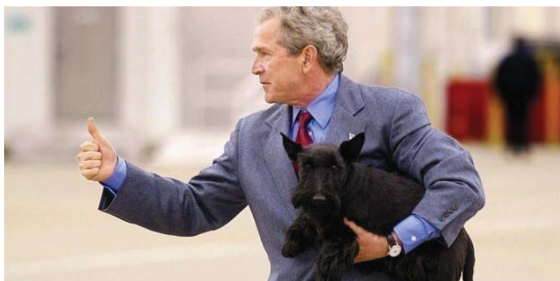
George Bush et son chien Barney (un scottish terrier)

Un vétérinaire publie un «Dictionnaire des chiens illustres», dont les maîtres s'appelaient Chopin, McCartney, Mitterrand ou Bush. C'est le gotha des clébard.