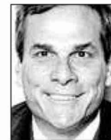
* Alumni et fellow de Harvard University, auteur de «Swiss made. Tout ce que révèle le succès du modèle suisse», Ed. Slatkine

Souvent, les clients ont décidé de placer leur argent chez Credit Suisse justement parce que c'est une banque suisse. Dans le passé, cette