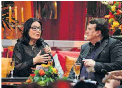
Avec la chanteuse Nana Mouskouri en 2012.