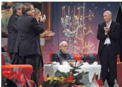
Alain Morisod avec l'abbé Pierre en 2002.

N° de thème: 844.003 N° d'abonnement: 844003 Page: 39 Surface: 46'266 mm²