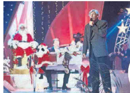
Avec le chanteur Jean Ferrat en 2001.