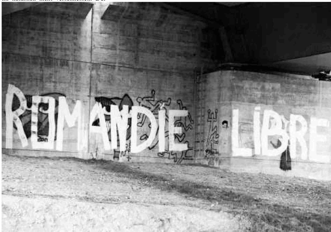
Um sich abzugrenzen – wie hier in den 1990er Jahren gegen den EWR –, taugt der ungeliebte Begriff «Romandie» allemal.

Die Idee ist nicht ganz neu, aber sie verdient eine Diskussion. Es ist aber alles andere als sicher, dass die neue Publikation eine solche Debatte auszulösen vermag. Es sieht ganz so aus, als hätten die Romands zurzeit andere Prioritäten. Der welschen Schweiz geht es nach wie vor gut, so dass eine Mehrheit der Romands wenig Lust auf Experimente verspürt. Es könnte allerdings sein, dass eine wirtschaftliche Abflachung und wachsende finanzielle Probleme der welschen Kantone dazu führen, dass der Ruf nach verstärkter institutioneller Zusammenarbeit eines Tags wieder vermehrtes Echo findet.