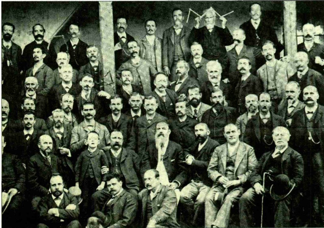
1891. La chambre syndicale à Veyrier.

N° de thème: 844.003 N° d'abonnement: 844003 Page: 4 Surface: 79'289 mm 2