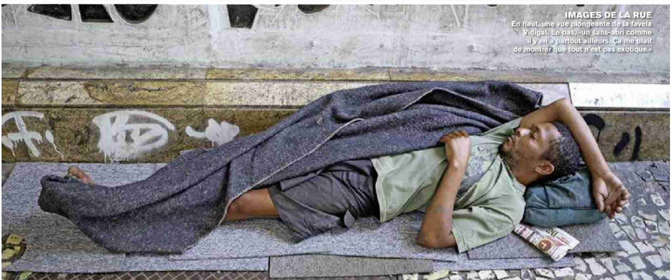
IMAGES DE LA RUE En haut, une vue plongeante de la favela Vidigal. En bas, «un sans-abri comme il y en a partout ailleurs. Ça me plaît de montrer que tout n'est pas exotique.»