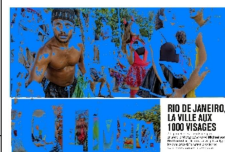
RIO DE JANEIRO LA VILLE AUX 1000 VISAGES

L'illustré 1002 Lausanne 021/ 331 75 00 www.illustre.ch