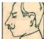
Rainer Maria Rilke 1875-1926 Poète

«Etoy est d'une beauté merveilleuse. C'est maintenant la plus belle saison de ce lac, le genêt fleuri...»