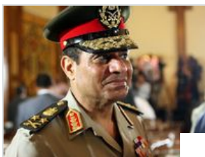
Le général Abdel-Fattah el-Sissi avait pris la tête du coup d'Etat contre Mohamed Morsi.

Une délégation égyptienne de personnalités opposées au coup d'Etat militaire est actuellement en visite à Genève, à l'invitation de la Fondation Cordoue.