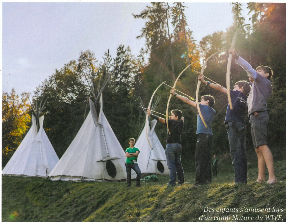
Des enfants s'amuse lors d'un camp Nature du WWF.