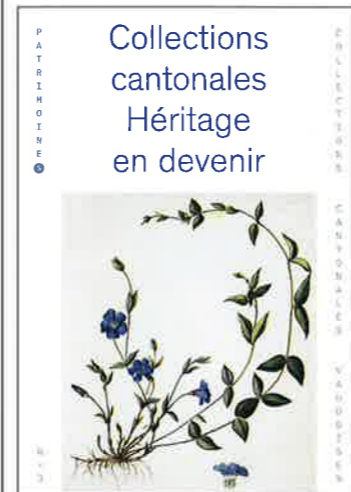
Collections cantonales. Héritage en devenir , sous la direction d'Ariane Devanthery, Lausanne (PatrimoineS, n° 3), 2018.