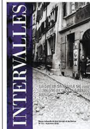
Revue Intervalles , n° 111, Bienne, automne 2018.

par exemple, raconte qu'il avait participé à «une manifestation d'affamés» qui brandissaient «d'effrayants drapeaux rouges». Pour l'historien Julien Steiner, coordinateur de cette publication, la grève a trouvé un terreau fertile dans la région. Celle-ci est en effet très industrialisée. Bilingue, elle rassemble des manières de penser divergentes, créant des sources de tensions. Depuis le XIX e siècle, sous l'impulsion d'anarchistes et de représentants de l'Internationale socialiste, le Jura bernois a acquis une fibre syndicale forte. L'ouvrage de 112 pages, qui ne manque pas de situer la Grève générale dans son contexte national, publie aussi des rapports que les communes du Jura bernois avaient adressés aux autorités cantonales sur les événements qui se seraient produits sur leur sol. Si la Suisse n'a connu qu'une seule grève générale, les conflits sociaux n'ont pas été absents dans le pays. Intervalles fait aussi le point sur les grèves d'aujourd'hui, s'arrêtant en particulier sur celles qui se sont produites en 2004 et 2006 chez Swissmetal Boillat à Reconvilier.