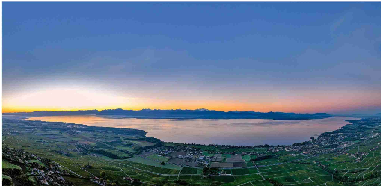
Le Léman vu du Signal-de-Bougy, au lever du soleil. OLIVIER RIETHAUSER