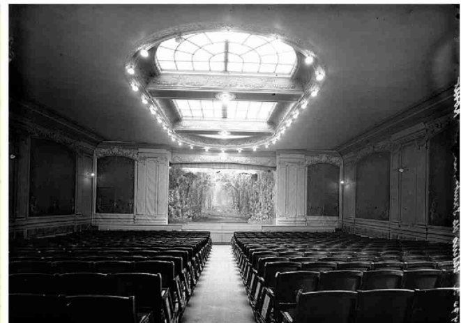
En haut: le 11, Grand-Rue, où eut lieu le premier concert. En bas: la Société helvétique de musique débarque à Genève en juillet 1826, et la salle du Casino de Saint-Pierre, utilisée dès 1825 par la Société de musique puis par le Conservatoire.