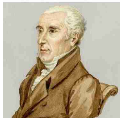
Marc-Auguste Pictet. BGE

Notre Société de musique se dépêche d'adhérer à la SHM, afin de pouvoir accueillir l'une de ses prochaines fêtes