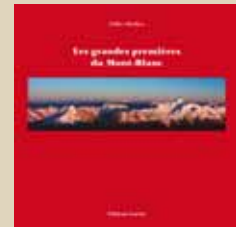
REF. Les grandes premières du Mont-Blanc Par Gilles Modica Ed. Guérin, Chamonix, 2011