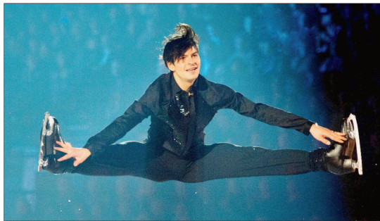
Stéphane Lambiel, chouchou des Suisses, est une des stars du spectacle 2013.

Doris Walker, employé de la chaîne de magasins Macy, cherche désespérément quelqu'un pour jouer le rôle du Père Noël afin d'animer sa boutique pendant les fêtes. Il embauche finalement Kris Kringle, un huluberlu qui prétend être le vrai Père Noël. Devant le scepticisme de son employeur, mais aussi de la petite fille de celui-ci, Susan, Kris décide d'aller au tribunal pour apporter publiquement la preuve de son identité... Avec Edmund Gwenn, Maureen O'Hara, Natalie Wood.