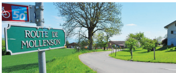
La route de Mollensson sera aménagée en vue de l'ouverture du nouveau zoo.

En effet, les conseillers ont estimé à une large majorité qu'il convenait de supprimer les trois places de parc prévues à l'embouchure du chemin des