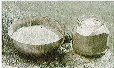
Le limon une fois ramassé (à g.) est séché au soleil avant d'être tamisé.