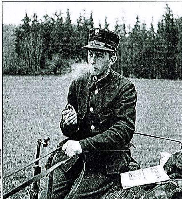
Le postillon au regard mélancolique. Il est un des derniers facteurs à distribuer le courrier à cheval, à un moment où se généralisent les véhicules motorisés. PALÉZIEUX, 1946