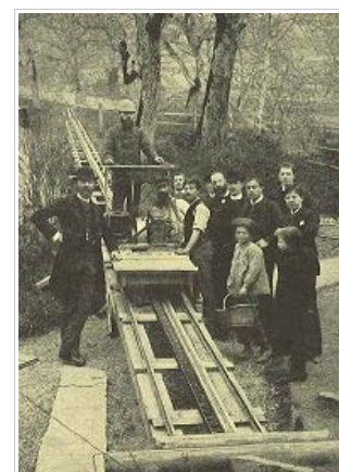
Traktionstest anno 1884