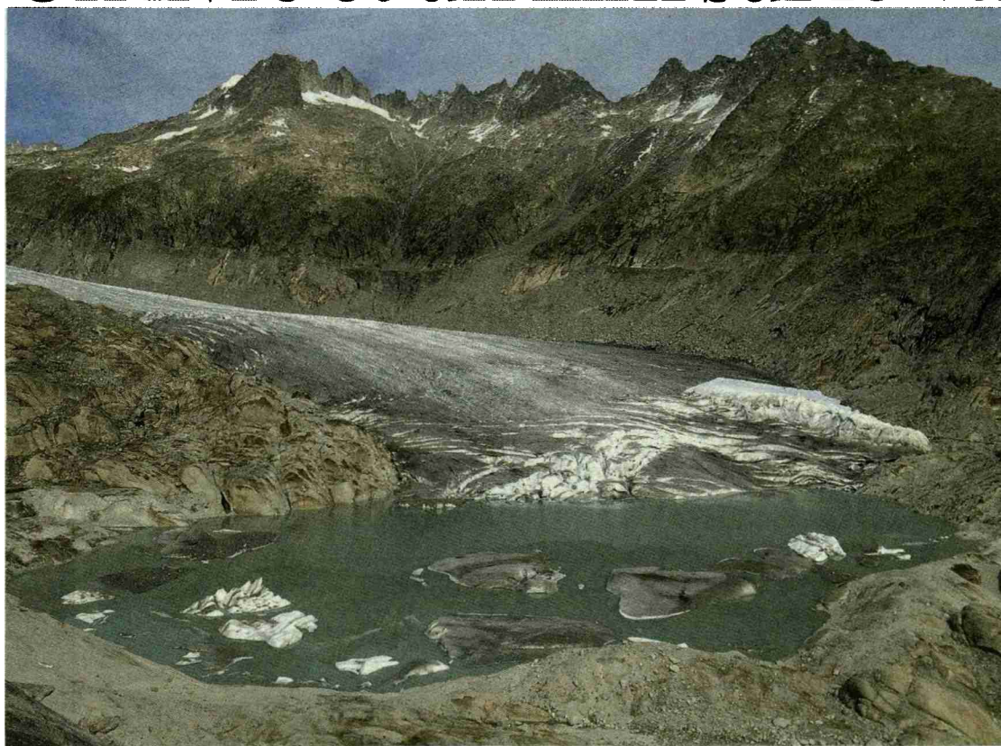
Départ au lac du Rhône qui se forme au pied du glacier du même nom.

«Le Valais croit en son avenir avec optimisme et passion.»