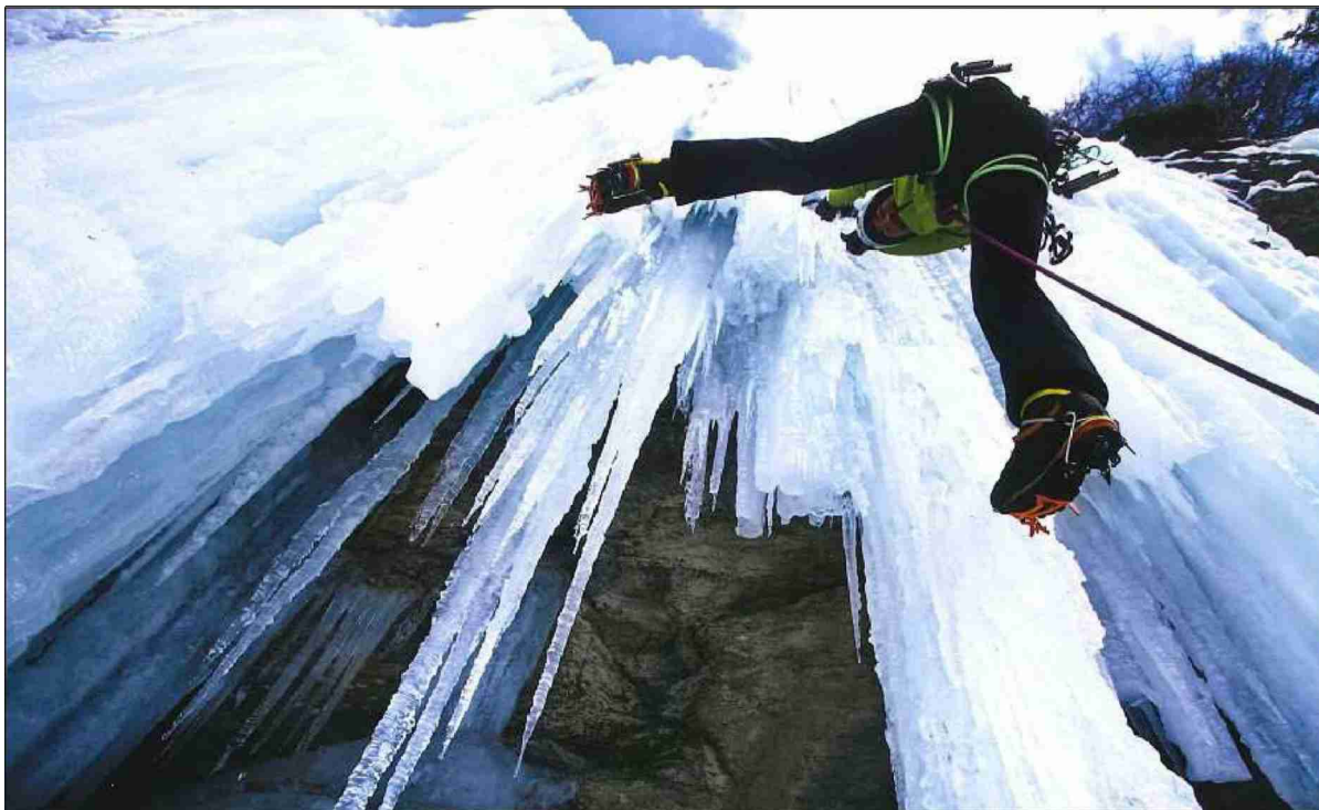
Le photographe sait s'entourer de modèles complicés. JIRI BE SKY

CLICHÉS • Jiri Benovsky s'est intéressé à l'image que l'on se fait de la montagne, et à la réalité de cette dernière. Parfois bien différentes.