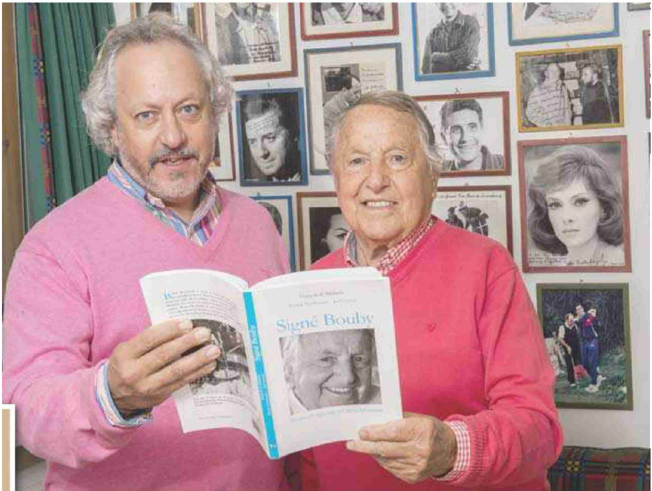
Aux murs, Bouby Rombaldi garde une trace de ses illustres hôtes. SACHA BITTEL