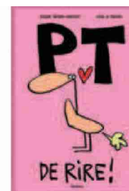
«PT de rire», Roger Simon-Vermot et Mix & Remix, Editions Slatkine, 112 pages, Fr. 19. –

La retraite ne semble donc pas de mise pour cet amoureux des mots. «Non! Je continue, et cela me va très bien. Ecrire est une soupape très bienvenue dans ma vie. J'aime créer, j'ai toujours des idées, des choses à faire.»