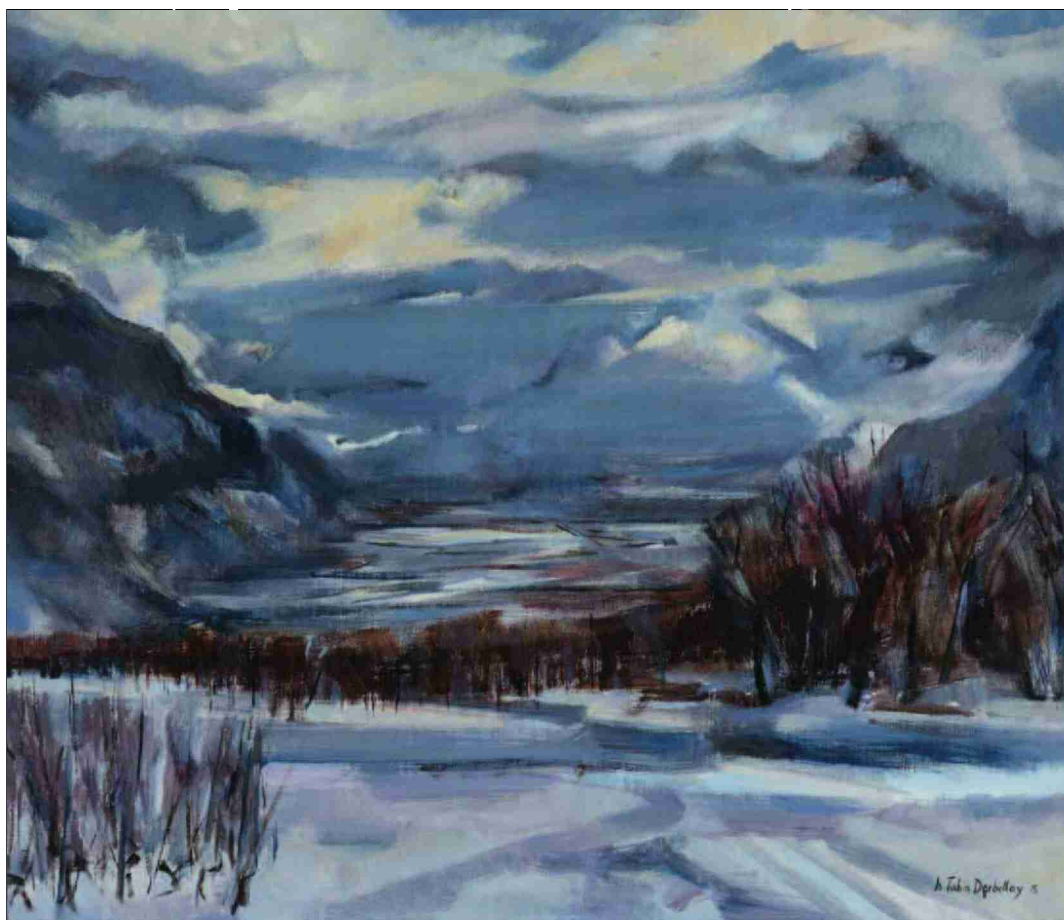
Lumière d'Hiver 2015, 70x80, propriété de la Commune de Savièse. © Robert Hofer