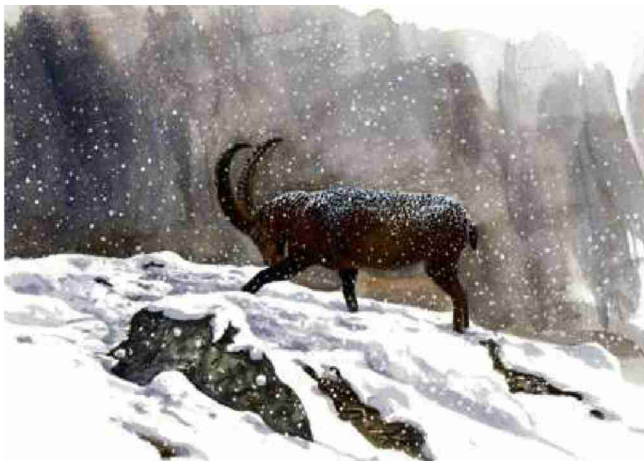
Ce bouquetin qui affronte un rude hiver dans le Parc national suisse a été réalisé à l'aquarelle en 2007. ÉRIC ALIBERT