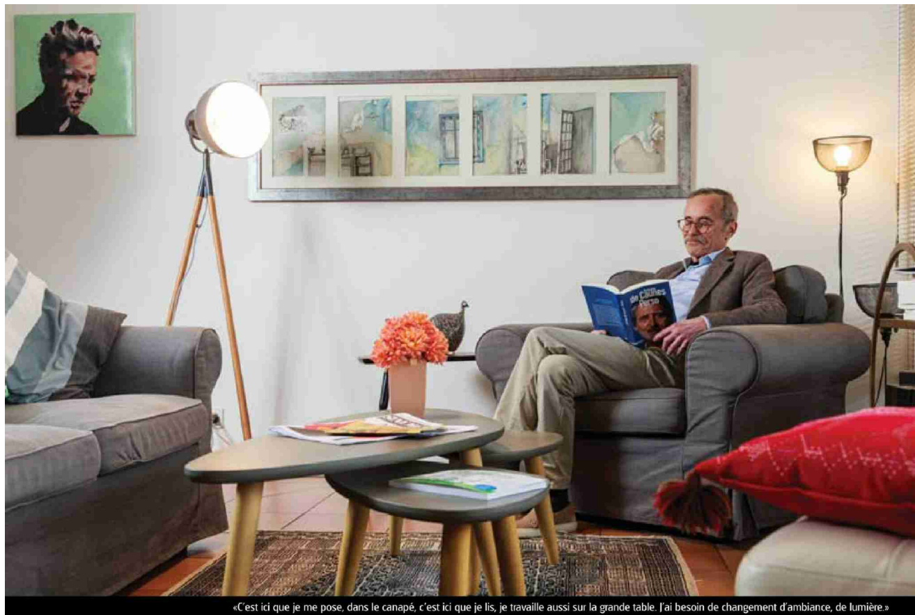
«C'est ici que je me pose, dans le canapé, c'est ici que je lis, je travaille aussi sur la grande table. J'ai besoin de changement d'ambiance, de lumière.»