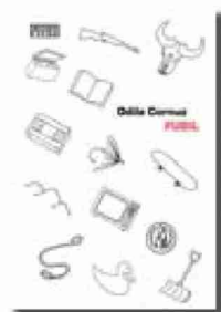
«Fusil» Odile Cornuz, Editions d'en bas, 160 pages

«Fusil» raconte une histoire d'amour dont on sait dès le départ qu'elle fut un échec. Scène après scène, une femme dévide le fil de son histoire avec un homme dont elle ne veut plus dans sa vie, une histoire qui s'est terminée quinze ans auparavant. Elle se souvient, parce qu'il a appelé: il veut récupérer sa carabine. Depuis le jour où elle a accepté sa demande en mariage, surprise au bord d'un étang où son enfant voulait attraper des têtards, jusqu'à la scène finale, où la haine se mue en violence, et le pardon n'est plus possible. En passant par l'érotisme du début, mais aussi sa jalousie à lui quand elle suit une formation. Un livre construit en une suite de chapitres autour d'un objet ou d'un lieu, un bocal, un terrain vague, dans des phrases complexes et délicates, qui n'occulent pas la rage d'avoir été mise en cage, la détermination de ne pas s'y laisser reprendre.