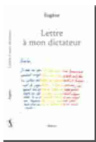
«Lettre à mon dictateur» Eugène, éditions Slatkine, 190 pages

Récompensé la semaine passée par un des prix suisses de littérature 2023, «Lettre à mon dictateur» s'adresse à Nicolae Ceausescu, qui habite dans sa tombe depuis vingt-deux ans, comme l'écrit son auteur. Né pendant la dictature en Roumanie, Eugène quitte son pays natal avec ses parents à l'âge de 6 ans, pour la Suisse, «un pays qui se méfie des chefs». L'auteur de maintenant 53 ans emploie comme à son habitude une écriture incisive et rythmée, manie humour et ironie avec bonheur, et rappelle qu'au début «la propagande communiste ne fonctionnait pas que sur les enfants de 5 ans». Dans cette lettre critique, joyeuse et vivante, Eugène retrace la place de Nicolae Ceausescu et de sa tyrannie dans l'histoire de sa famille et la sienne propre.