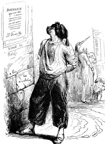
Vie privée et publique des animaux (1880), «Campagne électorale : la lecture de l'affiche», Gravure de Grandville.