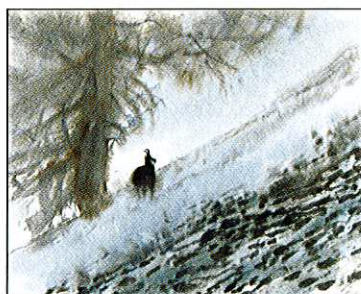
Chamoix et méléze

Éric Alibert, Voyage d'un peintre autour du Mont-Blanc 145 pages, relié. Éditions Slatkine Genève.