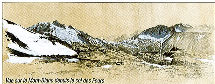
Vue sur le Mont-Blanc depuis le col des Fours